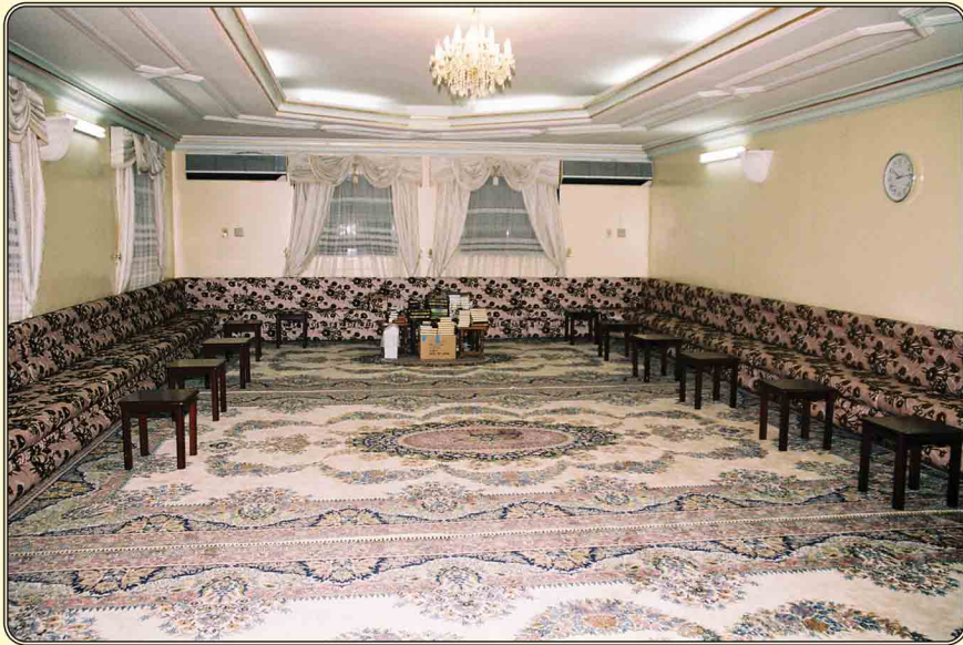
إحدى صالات الدروس والمراجعة